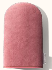
guante de bronceado