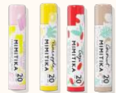
Bálsamos labiales SPF20 Original, Goji, piña, coco 4,8g