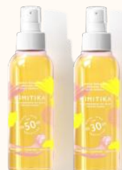
Aceites de protección solar FPS50 y FPS30 150ml