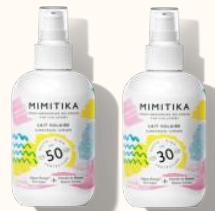
Loción de protección solar FPS50 y FPS30 190 ml